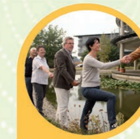
Hilfe bei der Gründung von Selbsthilfegruppen