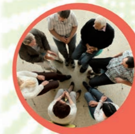
Vermittlung in Selbsthilfegruppen